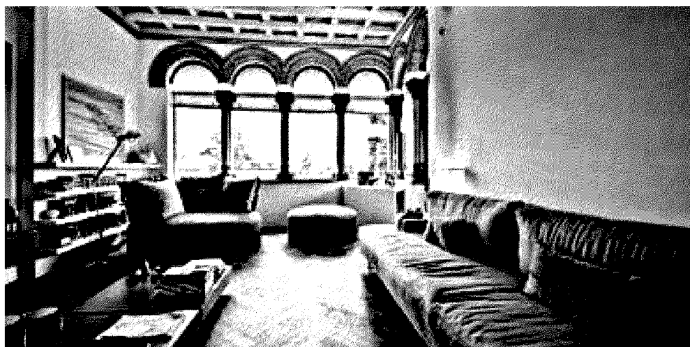
Appartamento in Viale Vittorio Emanuele II.