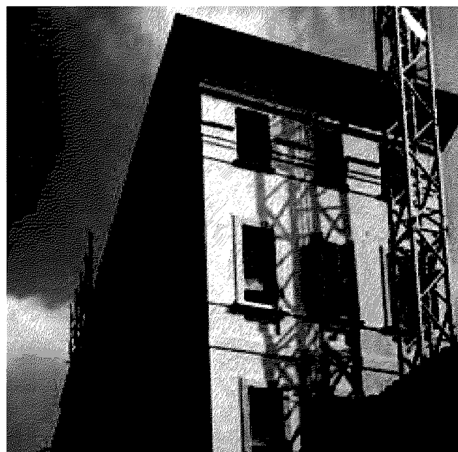
Il cantiere di Via Pradello.